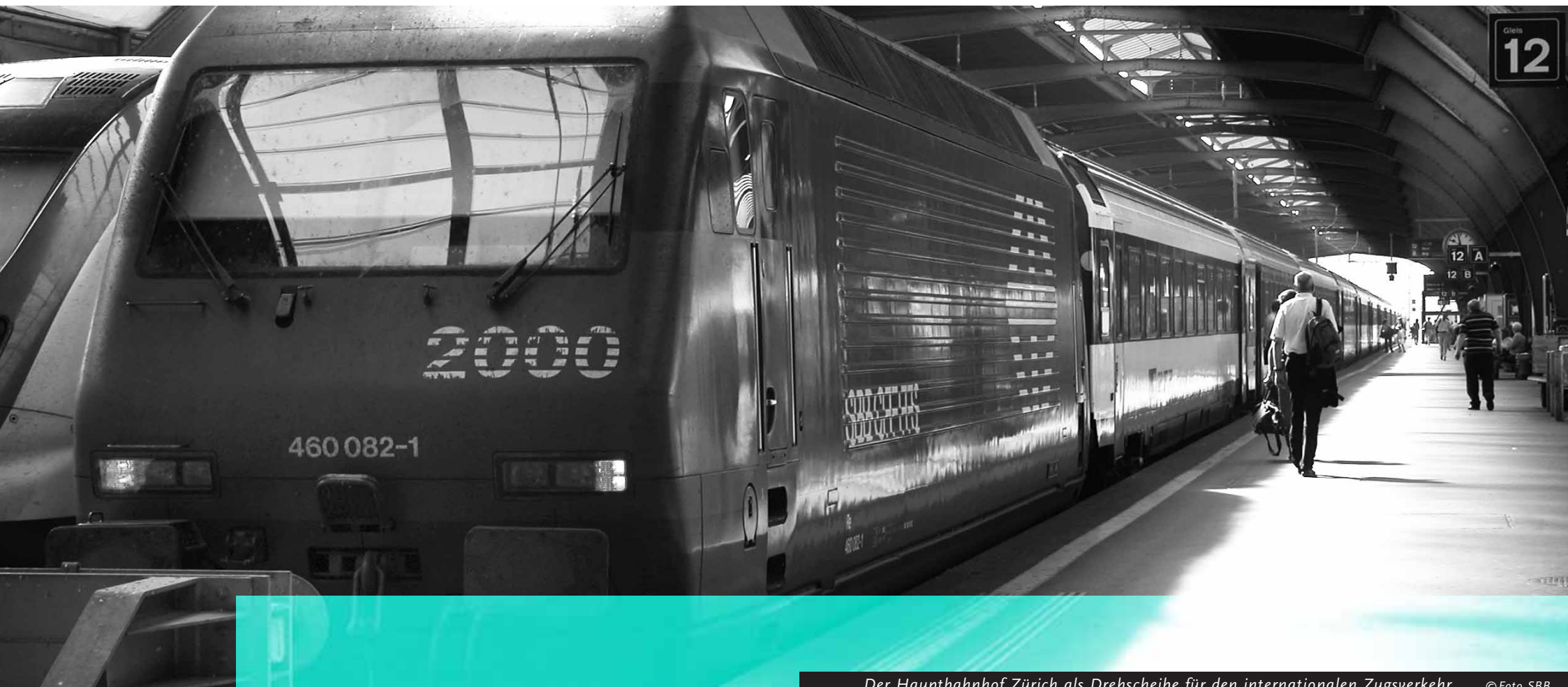
Der Hauptbahnhof Zürich als Drehscheibe für den internationalen Zugverkehr