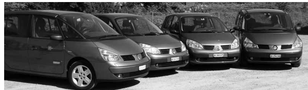
Die neue Fahrzeugflotte.

Im Zuge einer Erneuerung der gesamten Fahrzeugflotte entschied sich die Geschäftsleitung für eine gestaffelte Ablösung der Firmenfahrzeuge. Nach einer Evaluation entschied man sich für den Hersteller Renault mit je zwei Exemplaren der Serie ESCAPE und SCENIC. Die solide Verarbeitung, der hohe Sicherheitsstandard, das gute Beratungs- und Serviceangebot, der niedrige Verbrauch und nicht zuletzt das futuristische Design gaben am Ende den Ausschlag. Damit sind unsere Mitarbeiter sicher auf dem Weg zu Ihnen.