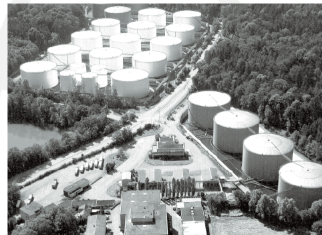
Gesamtansicht des grössten schweizerischen Tanklagers

Wir laden Sie herzlich ein, das grösste Tanklager der Schweiz zu besichtigen. Sie haben die Möglichkeit, das Tanklager Mellinger und die realisierte elektronisch gesteuerte Brandschutzanlage anlässlich einer ca. zweistündigen Führung zu besuchen. Teilen Sie uns Ihr Interesse auf dem beiliegenden Antwortalon mit.